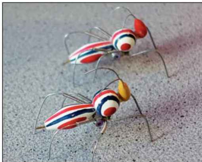
Un autre exemple : Un couple de «Contro'ohm binome». Une espèce rare qui contrôle les fruits bio.