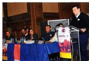
Pour chaque thème abordé, nous avons souhaité que partenaires et apiculteurs aient la parole afin de voir le sujet dans son intégralité.

Depuis 10 ans, vous alertez avec nous le grand public, les politiques et les