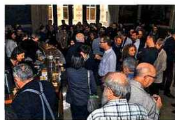
L'échange et la convivialité ont été le maître mot de cette journée !

Les journées de l'« Abeille, Sentinelle de l'Environnement® » sont désormais un rendez-vous incontournable donnant la parole aux apiculteurs qui sont les relais des messages du syndicat national qui est votre voix à tous auprès de très nombreux médias.