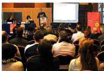
De nombreux partenaires et apiculteurs ont répondu présent à ce rendez-vous de la 10 e année du programme !